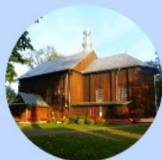
Kościół pw. Św. Jana Chrzciela i Św. Barbary w Ulanowie.