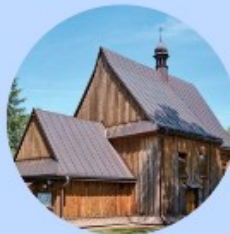
Kościół pw. Św. Onufrego i Niepokalanego Serca NMP w Dąbrówce.