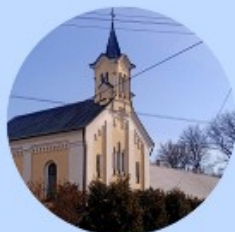
Klasztor i Kościół Dominikanek w Bielinach