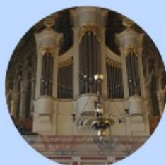
Jedynie w Polsce organy o brzmieniu barokowym.