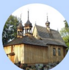
Kościół Rzymskokatolicki pw. Św. Trójcy Jedynie w Polsce organy o brzmieniu barokowym.