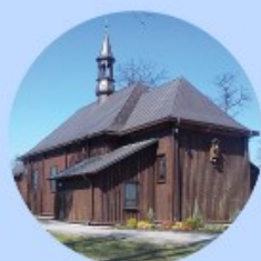
Kościół pw. Św. Marii Magdaleny w Kurzynie Średniej.